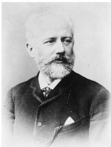
Piotr Ilitch Tchaïkovski

Casse-Noisette est un ballet classique en deux actes connu dans le monde entier dont la musique a été composée par Piotr Ilitch Tchaïkovski, le livret et la chorégraphie créés par Marius Petipa. Il s'inspire de l'Histoire d'un casse-noisette d'Alexandre Dumas tiré d'un conte d'Hoffmann. Casse-Noisette est représenté pour la première fois au Théâtre Mariinsky de Saint-Petersbourg le 18 décembre 1892.